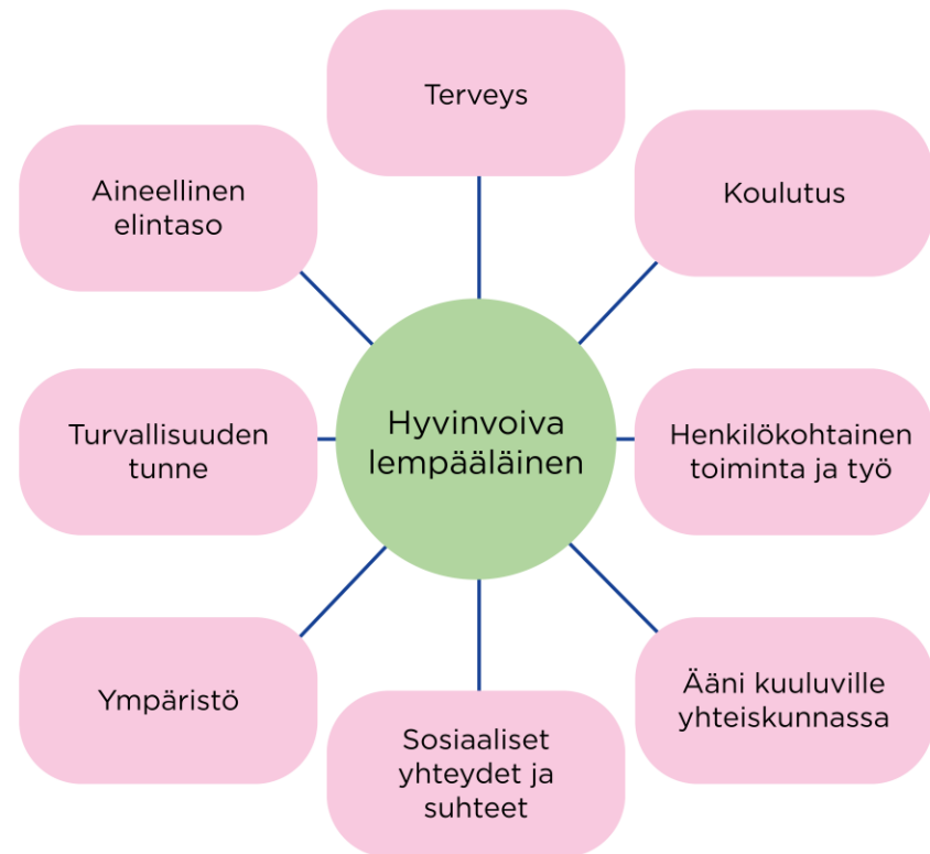
Kuvio 2. Stiglitzin komission hyvinvoinnin osa-alueet (Stiglitz J., Sen, A., Fitoussi, J-P. 2009: Report by the Commission on Measurement of Economic Performance and Social Progress)

Hyvinvoinnin, terveyden ja osallisuuden edistämistyön tavoitteena on vaikuttaa kuntalaisten elämän sujuvuuteen, mahdollisuuksiin huolehtia omasta hyvinvoinnista sekä kokemukseen toimivasta ja merkityksellisestä arjesta Lempäälässä.