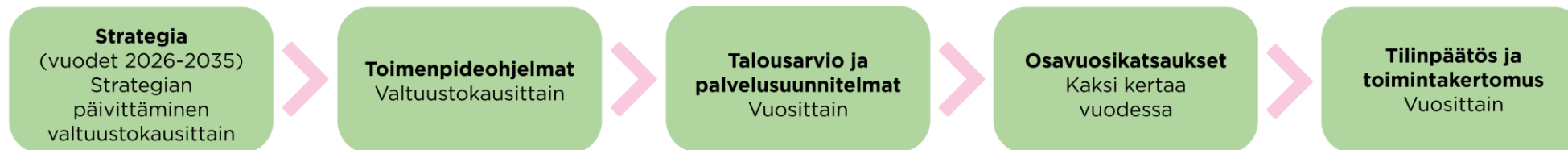
Kuvio 1. Lempäälän strateginen johtamismalli

Lisäksi kuntalaisten elinoloja, hyvinvointia, terveyttä ja osallisuutta sekä niihin vaikuttavia tekijöitä seurataan hyte-kerroin indikaattoreilla sekä Terveyden ja hyvinvoinnin laitoksen ohjaamalla hyvinvointikertomuksen vähimmäistietosisältöön kuuluvilla indikaattoreilla.