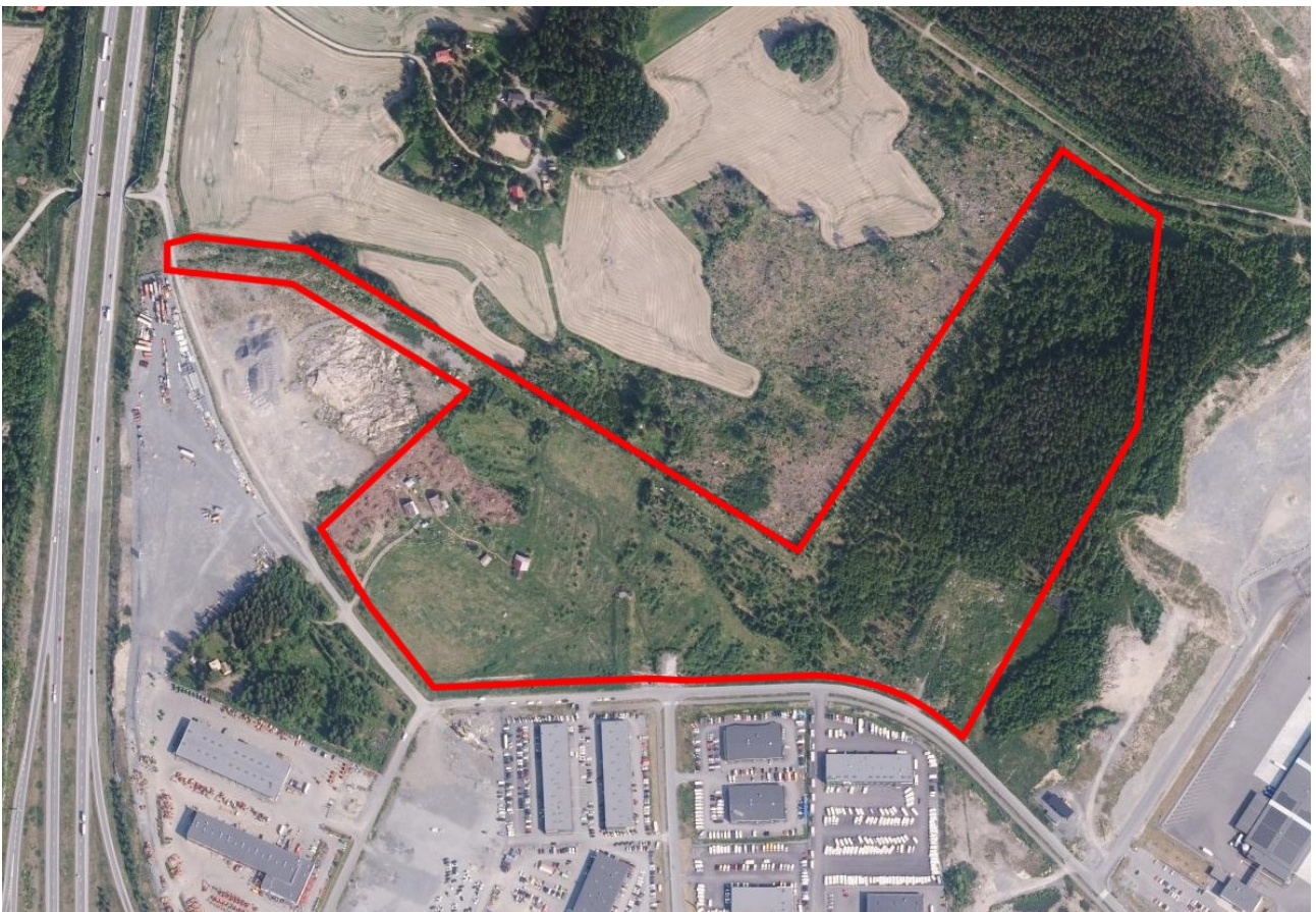
Kuva: Asemakaavan muutosalue rajattuna punaisella.

Kaava-alue sijaitsee Lempäälän Marjamäessä, Realparkin alueen pohjoispuolella olevien neljän kiinteistön osasta. Kaava-alueen koko on 183 653m 2 eli noin 18,3 ha. Alue on ennestään asemakaavoittamaton. Kaava-alue sijoittuu Realparkinkadun ja Kalliokumuntien pohjoispuolelle. Kaava-alue on lähes kokonaan Lempäälän kunnan omistuksessa, mutta se sisältää myös pienen osan yksityisessä omistuksessa olevasta kiinteistöstä 418-425-0001-0178.