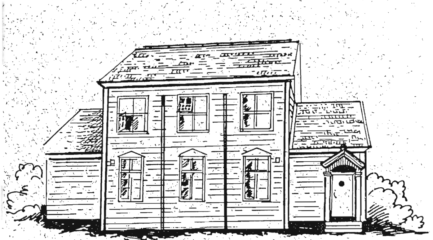
Säjäläisten vanha kansakoulu. Tuhoutunut tulipalossa 1951.

sen oman koulun elinvoimaa, ja säijäläiset näkivät taustalla isäntien pyrkimuksen pitää yllä säätyeroa. Koulu kuitenkin syntyi, ja molempiin riitti jatkuvasti oppilaita. Koulun syntyvaiheiden riitoja muistellaan yhä, ironisesti naureskellen. Kaunaa ei asiaan enää liity, mutta muisto tuntuu yhdistävän säijäläisiä ja lisäävän yhä kylän me-henkeä. 22