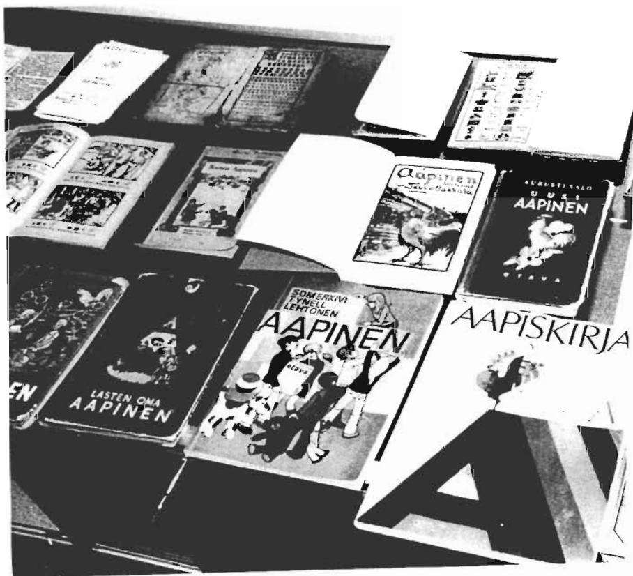
Muuttuva koulukirja. Aapisnäyttely Lempäälässä. Lempäälän - Vesilahden Sanomien arkisto.

Vertauskohdaksi nousee hakematta vuosi 1918. Lempäälässä työväenjärjestöjen paperit on tuolta ajalta hävitetty. Näkee, että pöytäkirjoista on kiireellä revitty sivuja irti. Toisinaan kadoksissa ovat kokonaiset paksut pöytäkirjat, jolloin kollektiivisesta muistista on hävitetty jopa kymmenen vuoden tiedot. Jäljelle jää eri tavoin ajattelevien ihmisryhmien muistitieto, erilaiset ja keskenään ristiriitaiset totuudet. Ne eivät siedä toisiaan ja kaihtavat ulkopuolistakin analyysia.